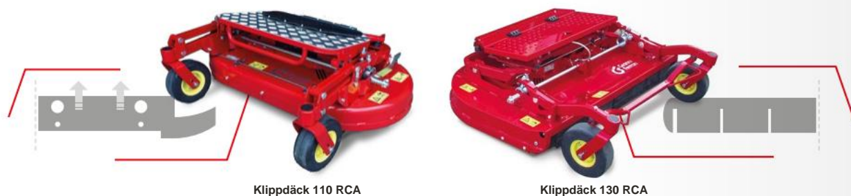
Klippdäck 110 RCA