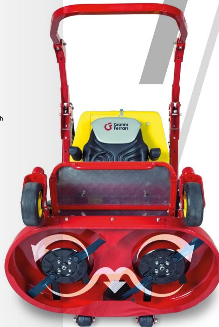
Omvänd rotation av bladen